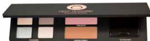
KEEP GLOWING PALETTE ART. NO 904KO Veil utpris kr. 499,-