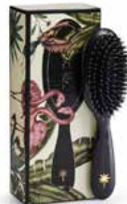
Stardust - small