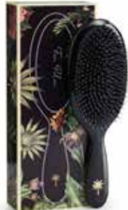
Stardust - large