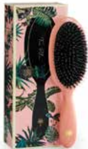
Flamingo - medium