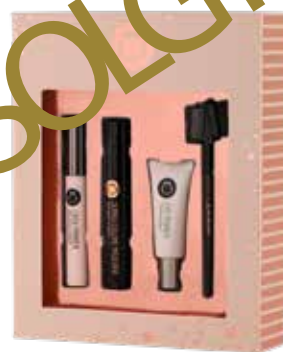
GAVEESKE MAKEUP ART. NO. 2015KO Veil utpris kr. 499,-