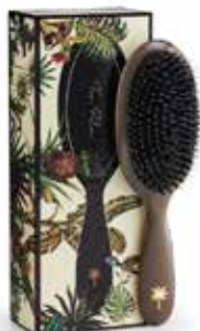
Mink - medium